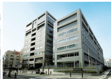
日本歯科大学生命歯学部