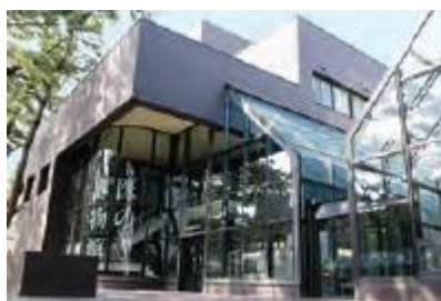
日本歯科大学 医の博物館