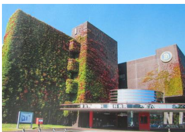
日本歯科大学新潟生命歯学部