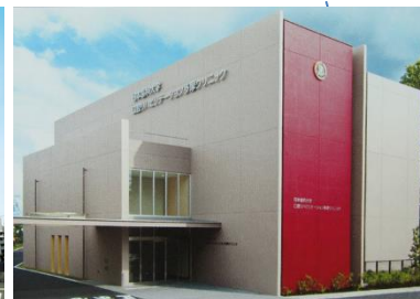
日本歯科大学 口腔リハビリテーション多摩クリニック